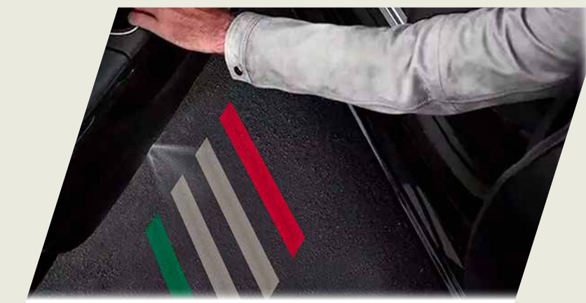
PROYECTOR DE LOGO FIAT