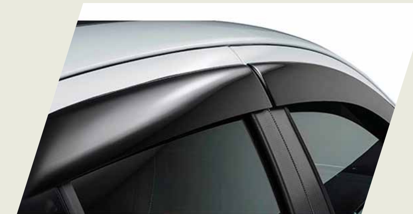
DEFLECTOR DE LLUVIA