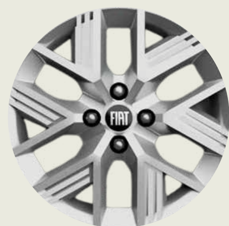
Llantas de aleación 15"