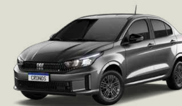
979 - Gris Silverstone