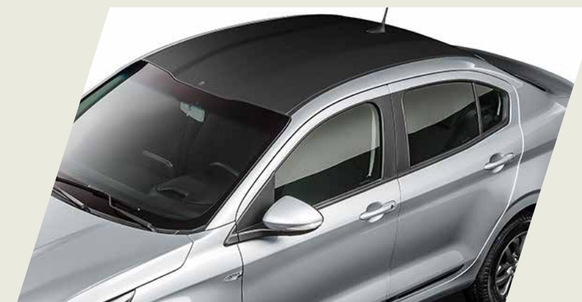
VINILO NEGRO PARA TECHO