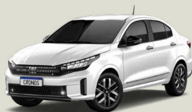
249 - Blanco Banchisa