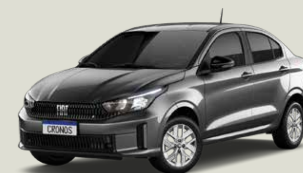
979 - Gris Silverstone