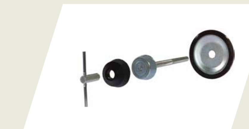
BULÓN DE SEGURIDAD PARA RUEDA DE AUXILIO