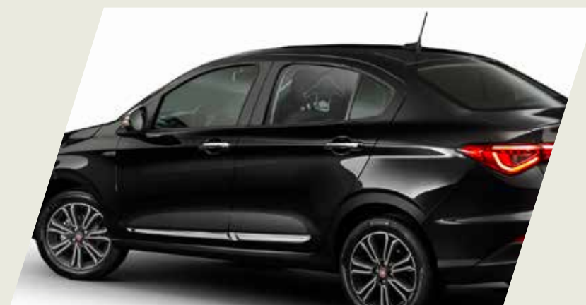
MOLDURA DE PUERTA CROMADA