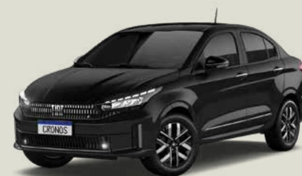
806 - Negro Vulcano