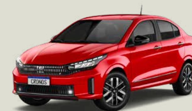
978 - Rojo Montecarlo