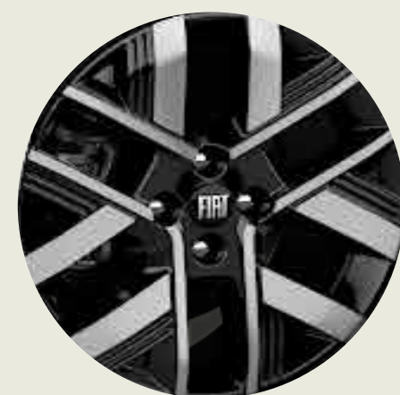
Llantas de aleación 16" esmaltadas