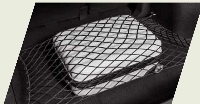
RED ELÁSTICA PARA BAUL