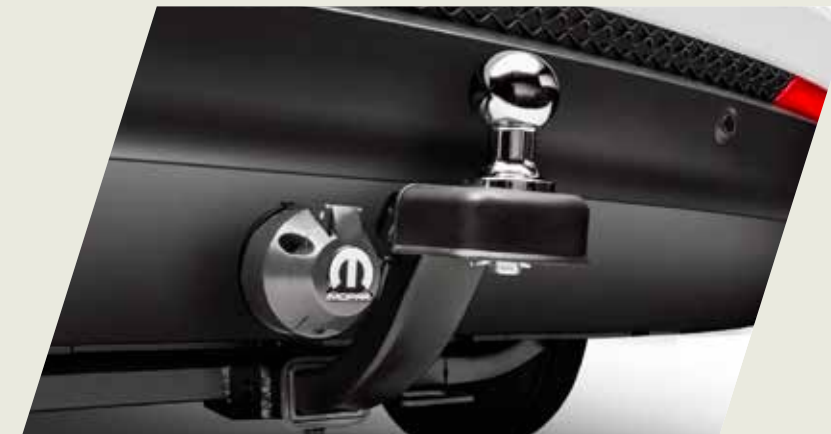
GANCHO DE REMOLQUE