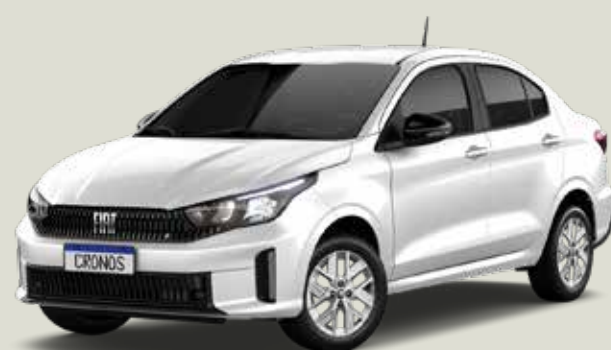
249 - Blanco Banchisa