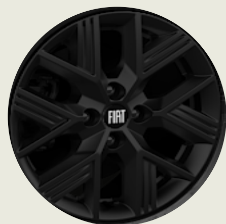
Llantas de aleación 15" oscurecidas