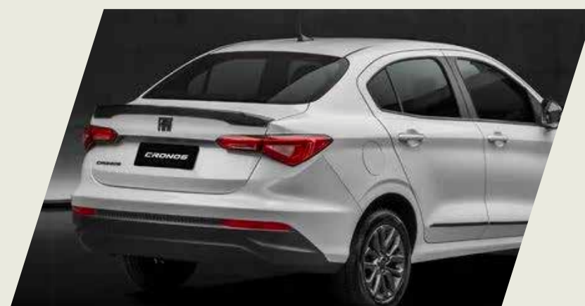
SPOILER TAPA BAÚL