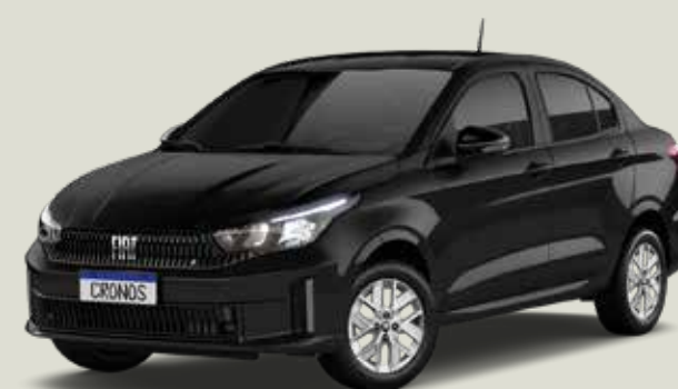
806 - Negro Vulcano