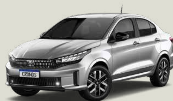
619 - Plata Bari