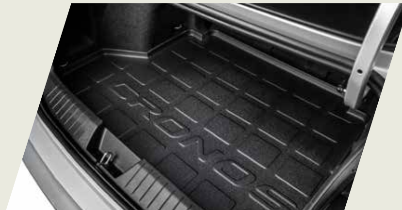
ALFOMBRA BAUL ANTIDERRAME