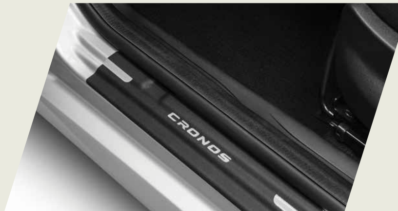
PROTECTOR DE ZÓCALO EN VINILO

Acercate a un concesionario y conocé la gama de accesorios originales que mopar te ofrece para equipar tu fiat Cronos, seguido de las imágenes de cada accesorio.