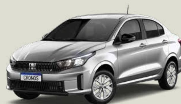
619 - Plata Bari