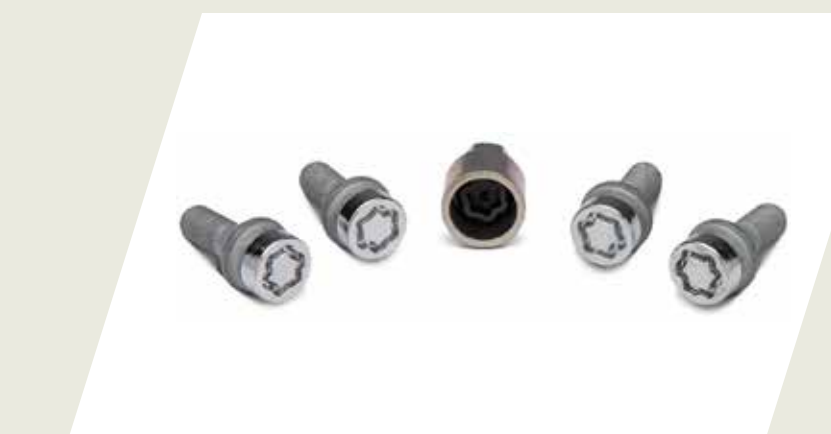
JUEGO DE TORNILLOS ANTIROBOS PARA RUEDA