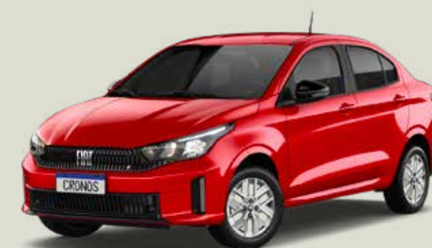
978 - Rojo Montecarlo